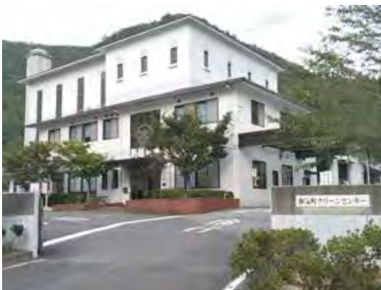
和気町クリーンセンター (益原)