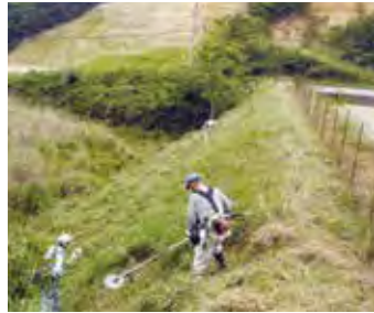
傾斜地の草刈作業