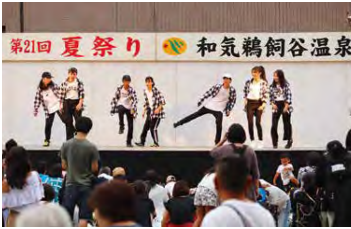
多くのお客様でにぎわう鵜飼谷温泉夏まつり

答 宿泊者の多くがビ ジネスでの利用で、 洋室を好む方が多 くなってきており、 今後リニューアル も必要であると考え ている。なお、改 修にあたっては相 当な予算を伴うも ので、今後、有利な 財源なども検討し、 町民の財産である 観光施設の灯を消 すことがないよう 努力していく。