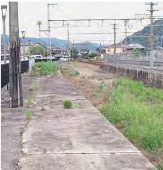
和気駅前駐車場予定地

答 農薬散布は稲の上 の低空飛行のため、 事故の確率は低い と思われるが、事 故が発生した場合 はドローンの保険 で対応する。