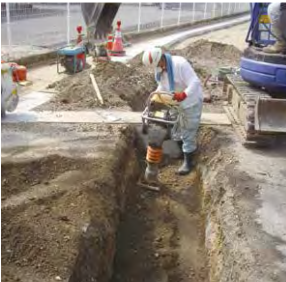
本管漏水に伴う修繕工事

法律の規定により事業ごとに計画しているが、全体事業の調整も重要だと認識している。