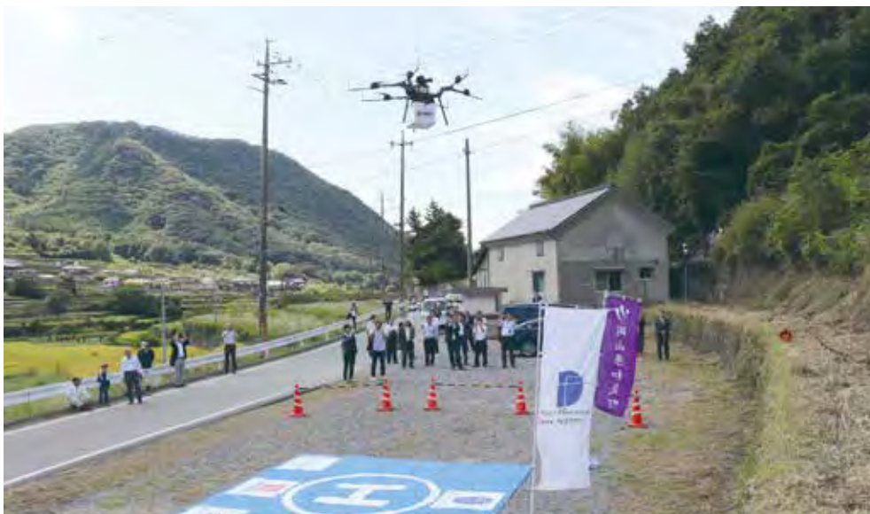
ドローン検証実験の様子