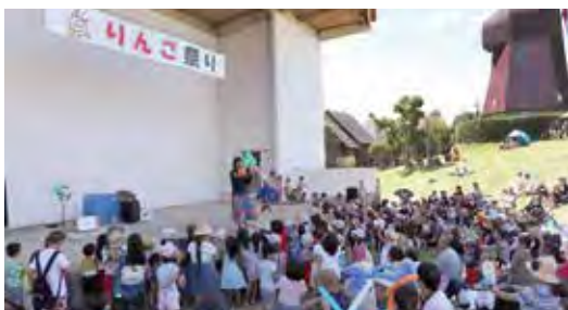
多くの人でにぎわう りんご祭り

駅前駐車場は満車の状態が続いており、送迎スペースや町営バスの待機所を含め、進めていきたい。