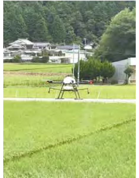
ドローンによる農薬散布