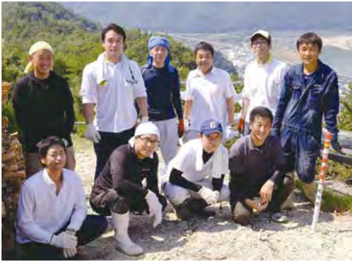
商工会青年部、OBの皆さんと和文字焼き準備作業

はじめ、ごく限られた人たちにのみ重い負担がかかっている。商工会青年部の方々も人数が減ってきて