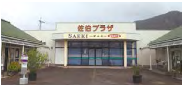
活用が望まれる旧佐伯プラザ

行政マンとしてスピード感をもって行政サービスに努めるよう凡事徹底してまいりたい。