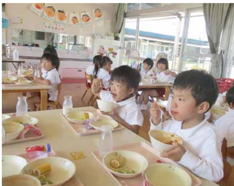
給食の様子（本荘にこにこ園）

基本的には「ひとり親」という基準になっており、祖母の場合も対象になると思うが、委員会でも改めて説明する。