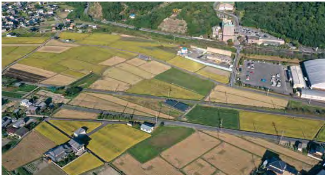
防災都市公園予定地

答 平成30年度国費繰 越分5200万円 は、和気町でしか 執行できないので、 事業が実施できな いことになれば、 5200万円は不 用額になる。