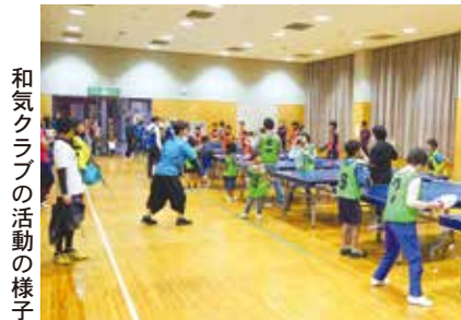
和気クラブの活動の様子