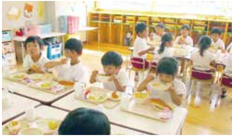
給食の様子 (本荘にこにこ園)

和気町では国の考えをふまえて、年収360万円未満世帯は500円の主食費を、年収360万円以上の世帯は主食費副食費合わせて5600円の負担である。これをもし、主食費副食費とも免