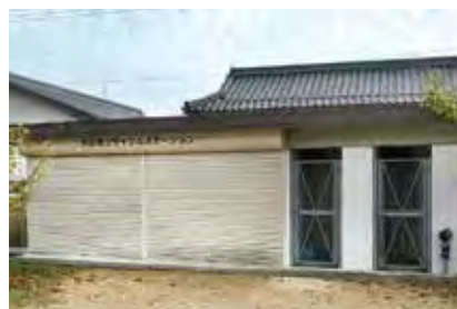
リサイクルセンター (矢田部)