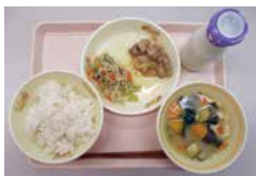
成長に重要な学校給食