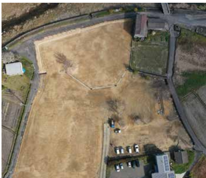
新日笠地区公民館建設予定地