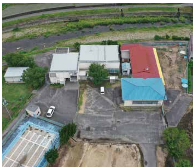
旧日笠地区公民館