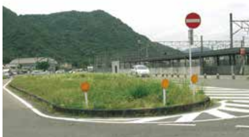
ミニ公園化が望まれる和気駅南ロータリー

問 交通安全上の問題をクリアして、駅周辺の憩いと安らぎの場の整備の必要性を理解し検討していただきたい。