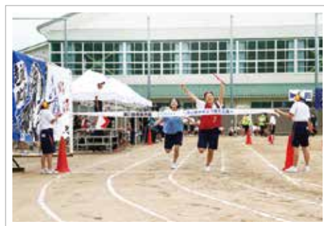
一部加工・トリミングして掲載しています。

コメント：6月5日に開催された和気中学校の飛翼大会の様子を撮影させていただきました。今大会はコロナ禍の影響(緊急事態宣言下)で無観客、半日開催となりましたが、この日のためにしっかり練習を重ねてきた生徒たちの、取り組む姿勢と笑顔が素晴らしい大会でした。なお、この様子は学校側の努力で、来場できなかった保護者のためにライブ配信されました。