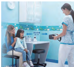
「屈折検査機器」による 健診の様子

屈折検査機器は国からの補助も検討されているので、令和4年度の当初予算に計上する。