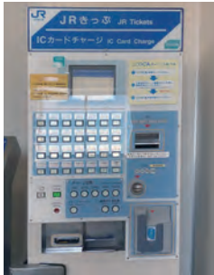
JR瀬戸駅2階券売機 (南口利用客用)