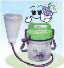
乾電池式ジベレリン処理器

ジベレリン処理とは満開期のぶどうの花に溶液をつける作業で、次の効果がある。 ・ぶどうを種なしにする ・ぶどうの粒を大きくする