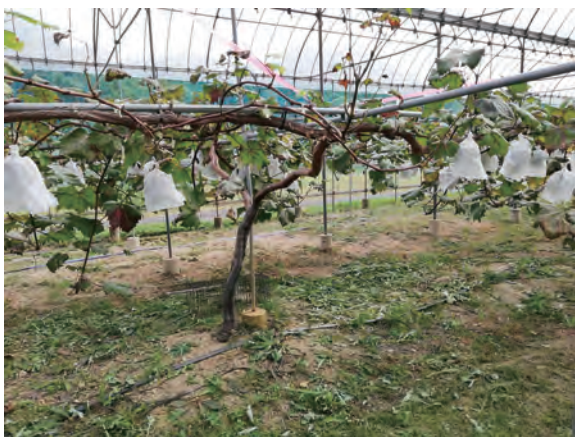
すもも園で試験的に栽培されているぶどう