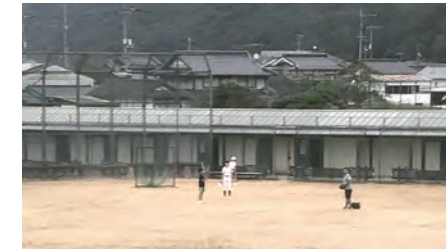
佐伯中学校の部活動の様子

部活動の専門分野は異動に考慮されないため配置は難しいが、和氣中に3名、佐伯中に1名の部活動指導員を