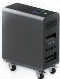
購入予定の蓄電池(イメージ)