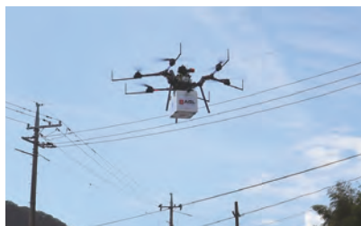
過去のドローン物流実証実験の様子

日笠上の受け入れ土について、公共事業である町の河川浚渫残土や岡山県及び国土交通省の吉井川を中心とした河川浚渫残土で民間の建設残土や産廃の受け入れはしない。受け入れ土量については計画地へ入る土量を計算したものであって現在堆積した土量ではない。現在、町内河川の