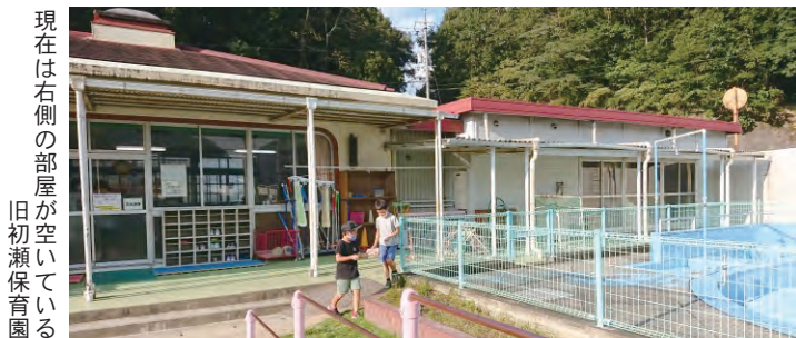
現在は右側の部屋が空いている 旧初瀬保育園