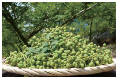
収穫されたサンシヨウの実

サンシヨウについては、獣害防止に効果があるとされており、安定した販路により着実な農業収入の確保が見込まれるとのこ