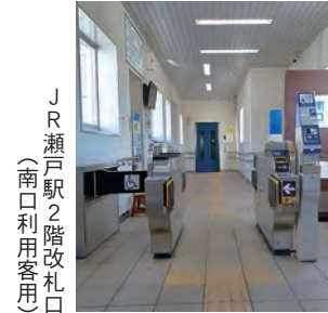
JR瀬戸駅2階改札口 (南口利用客用)

基本構想の前にEVだけを設置するという考え方もある。EVの設置が必要であることは十分理解できるので、検討する。