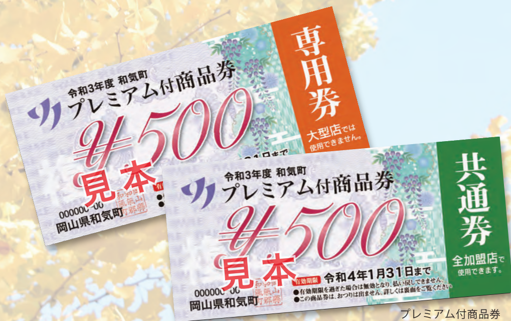
プレミアム付商品券