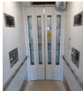
エレベーターの内側 (JR瀬戸駅)

から乗降するための改札口と券売機があった。和気駅は町にとって資源の一つであり、大切な施設だ。にぎわいの町づくりに必要な施設だ。町民の交流の場だ。友達と待ち合わせる場だ。EVがあったらもっと岡山に行けるの!! 生きているうちに奥さんを岡山に連れて行ってやりたい!! 岡