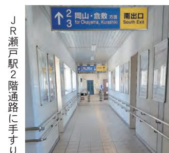
JR瀬戸駅2階通路に手すり

山に行つて帰りの電車を調べたら、和気駅止まりで2番線に着く。階段の昇り降りがある。つらい!! その結果、1便電車を遅らせて乗る。