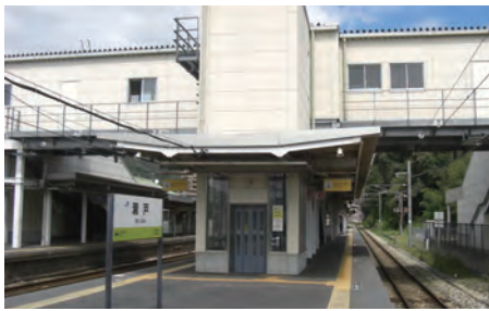
JR瀬戸駅に設置してあるエレベーター

これまでJRコンサル岡山支社へ委託し、ある程度の計画は進められてきている。今回のチャンスを見逃さず、事務レベルはもちろん、地元自治体の長として熱意をもって行