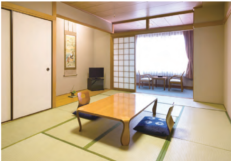
ベッドを設置予定の和室