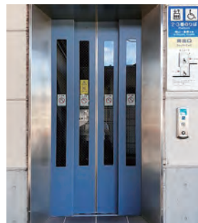
エレベーター正面の扉 (JR瀬戸駅)

表側と2番ホームと裏側の3機である。2階通路の両壁には上下2本の手摺りも設置されている。2階には裏側