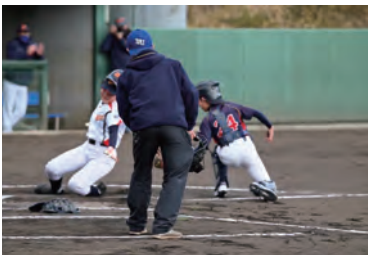
町長杯兼 IPU 杯争奪少年野球大会

問 今年文化の日のイ ベントの実施は。 答 環太平洋大学や和気 閉谷高校との共同イベ ントは。今後のイベント、 特に高齢者や配慮が必 要な方のイベントは。