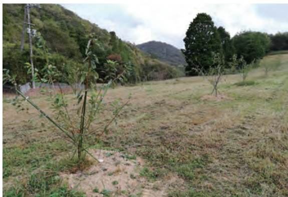
すもも園に植樹されたすももの苗木